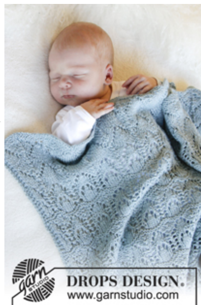
DROPS Baby 31-23

Garnforbrug ved alternativt garn - Brug vores garn-omregner her